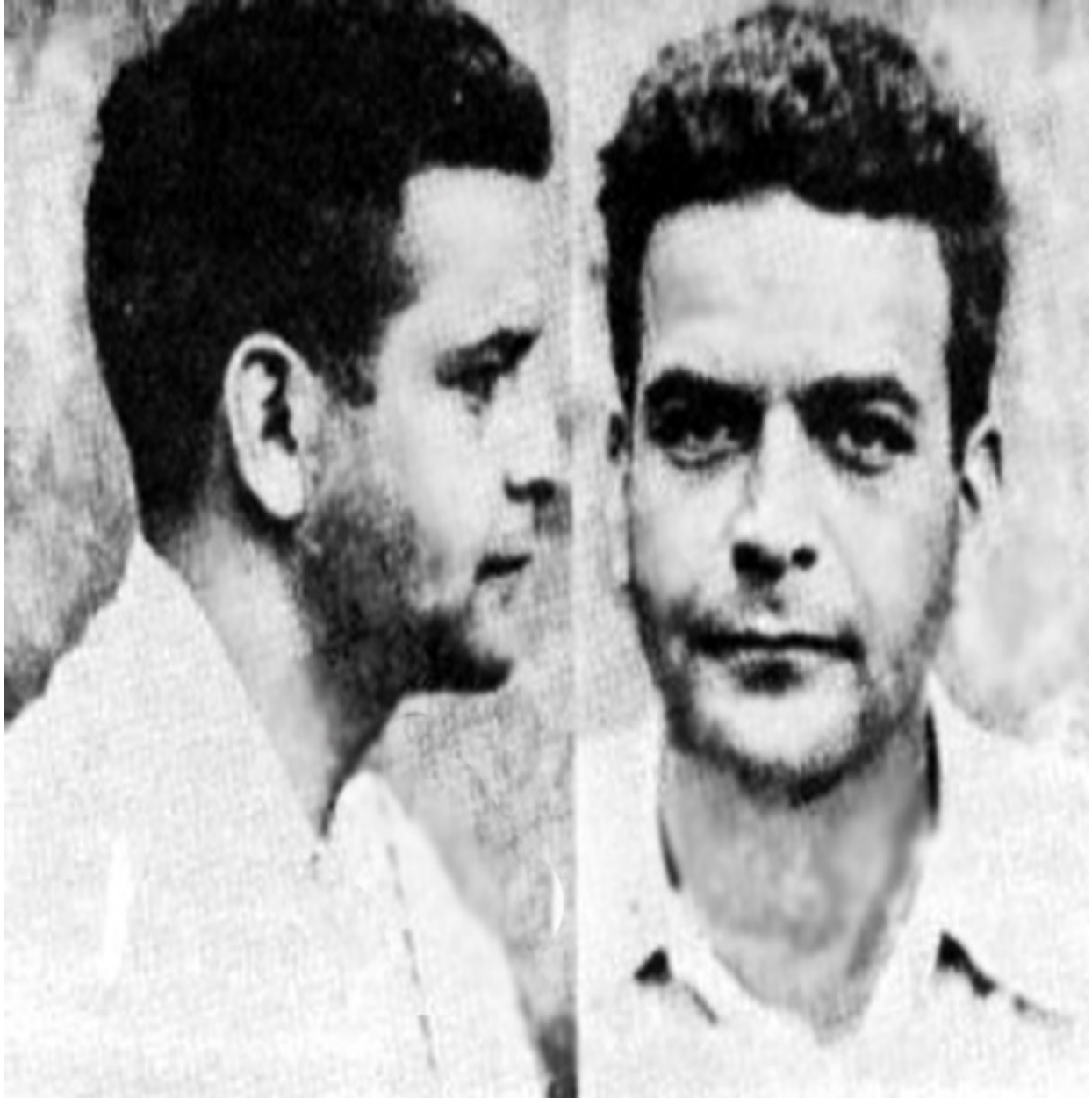
Frank Jacson o Jacques Mornard Vandendresch