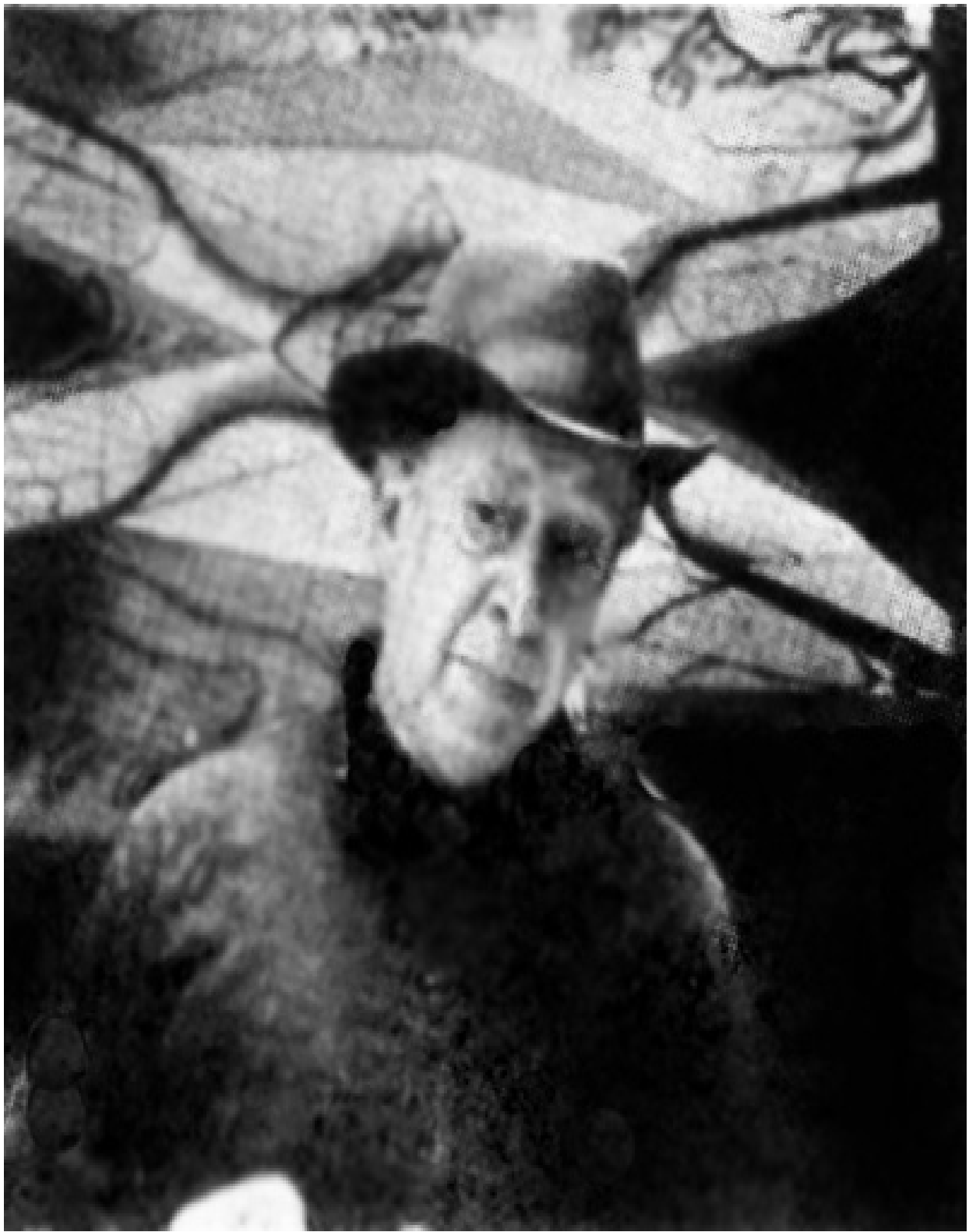
David Alfaro Siqueiros