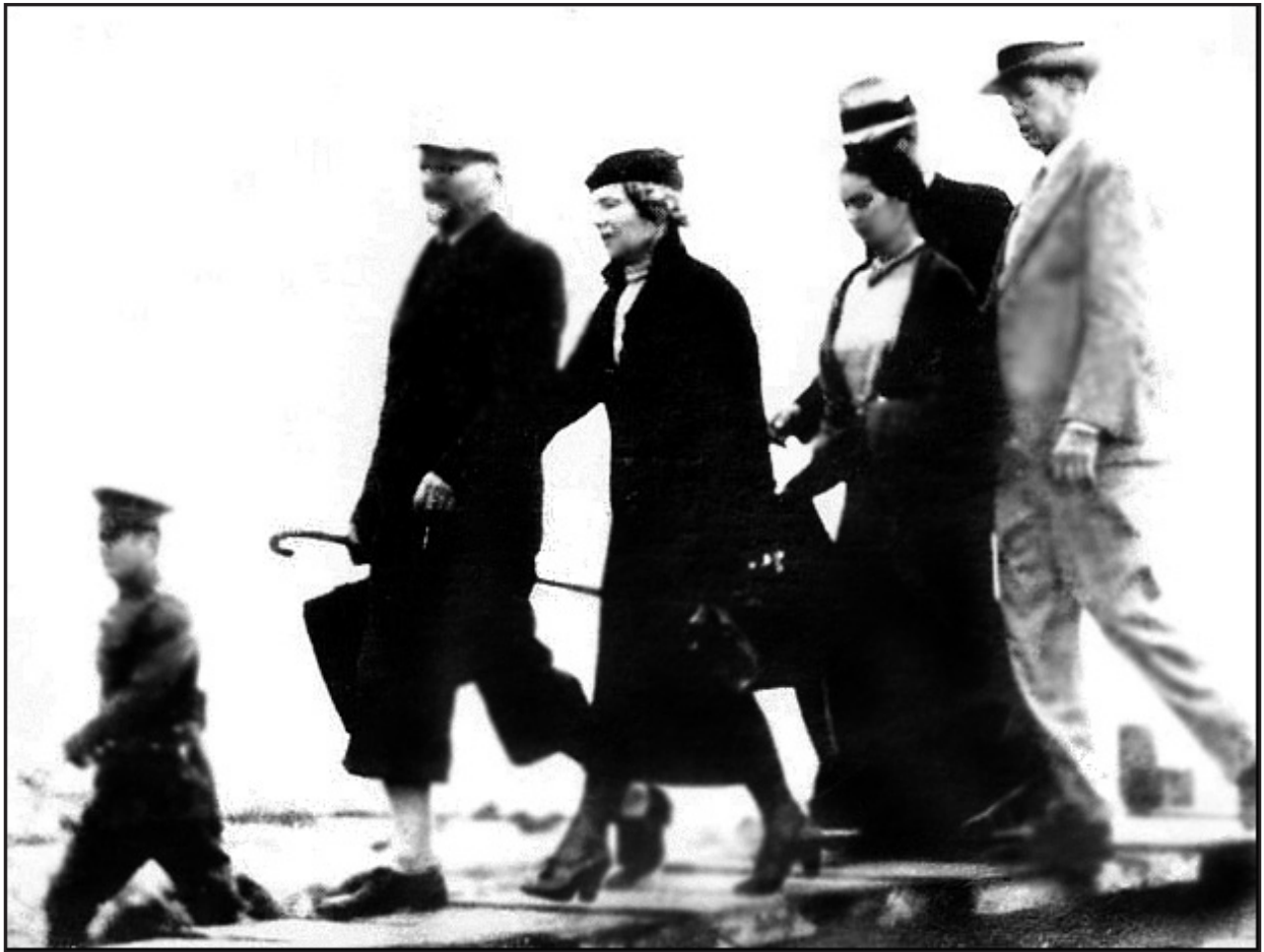
Leon Trotsky y su exilio en México 9 de enero de 1937