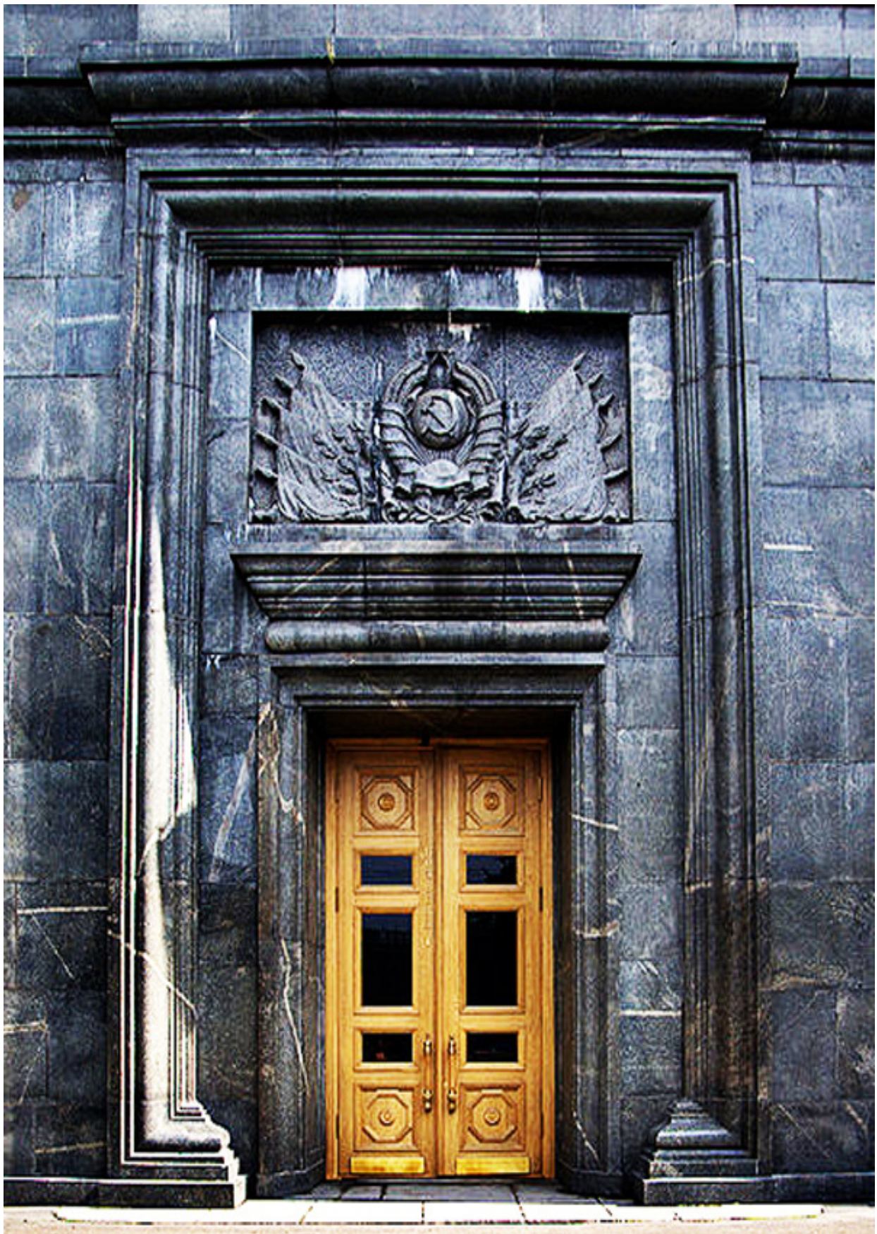
G. P. U. - 1932